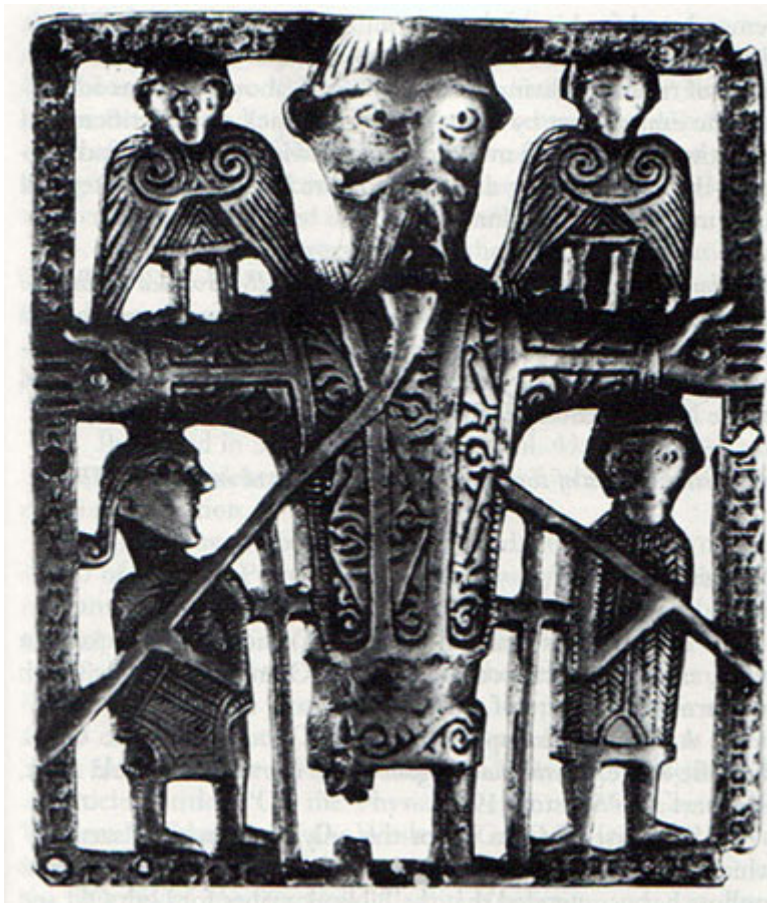
Ирландско-германская сцена распятия, в которой Христос представлен в традиции Одина / Водана, в сопровождении двух ангелов (воронов?) на его пле-

В этот ряд также вписывается самобичевание Одина, висящего на древе ради приобретения мудрости. Параллельно к этому вызывающий дискуссии рельеф на скалах Экстернштайна интерпретируется как изображение распятого.