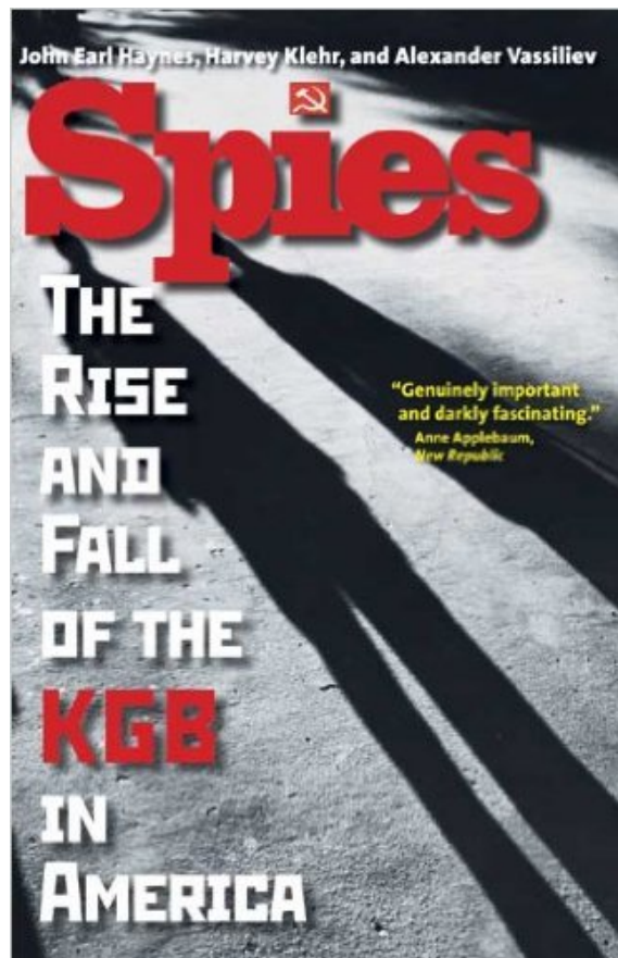
Обложка книги «Шпионы. Взлет и падение КГБ в Америке»